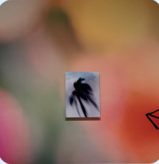
My Favorite in SFMOMA