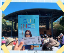
Concert in Stanford