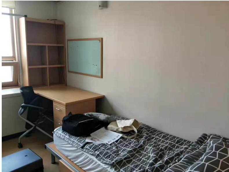
汉阳大学双人宿舍

大家简单熟悉了一下食堂，课程，教室等信息后，开始商量着第二天去哪里玩耍，决定第二天去比较知名的明洞，本来都是兴致勃勃的出发，结果走到一半路的时候，我肚子很难受，因为早上吃了辣辣的饭团，真的发现韩国人都很喜欢冷冷的，辣辣的食物，这一点让大家在学校待到第五天的时候就想吃中国菜，想回家，哈哈。